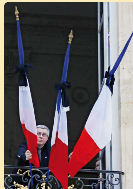
Cet homme plie des drapeaux au palais de l'Élysée.