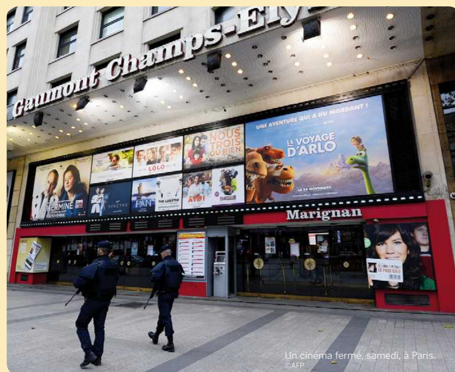
Un cinéma fermé, samedi, à Paris.