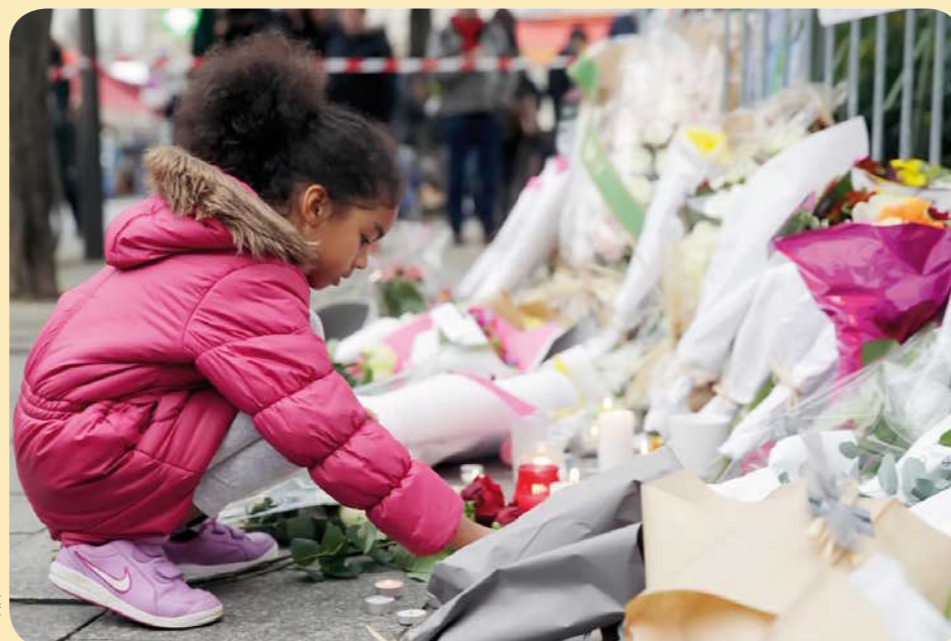
Des hommages. Des personnes déposent des bougies ou des fleurs devant les lieux des attaques ou dans d'autres endroits de Paris.

Dans le monde. Des monuments ont été éclairés aux couleurs du drapeau français. Ici, l'opéra de Sydney, en Australie (Océanie).