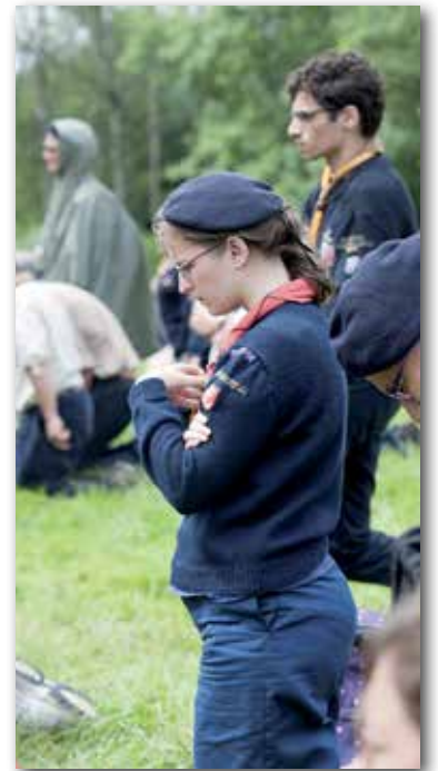
Propos recueillis par Paul Sugy

AG : Jusqu'au bout. Tenez jusqu'au bout ! Je sais qu'il y a la fatigue, la pluie, la boue... Mais ce n'est pas le moment de baisser les bras. Que chaque scout, chaque guide, serve jusqu'au bout, comme nous le disons encore au jour de notre Promesse : « s'il plaît à Dieu, toujours ! ». Et nous verrons que Dieu nous réserve des grâces infiniment plus grandes encore !