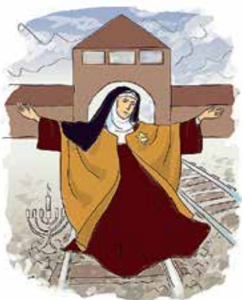
sainte Edith Stein

As an answer to the love received from Christ, guides and scouts had the possibility to consecrate themselves to his Sacred Heart, in order to spread throughout Europe peace, love and reconciliation received from Him.